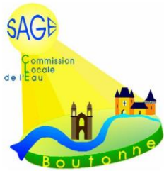
Schéma d'Aménagement et de Gestion des Eaux de la Boutonne